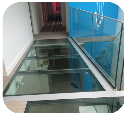
Dalles de plancher – Garde Corps (fournis par Normanver Glass)

Cette nouvelle fabrication vous permettra de répondre aux attentes de vos clients pour la création de garde-corps, dalles de plancher ou marches d'escalier etc... Possibilité de films de couleur pour la déco (consultez-nous).